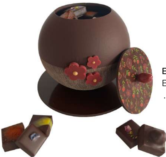
BONBONNIÈRE (GRAND MODÈLE) Bonbonnière garnie de 33 pièces