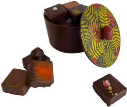
BONBONNIÈRE (PETIT MODÈLE) Bonbonnière en chocolat garnie de 8 pièces