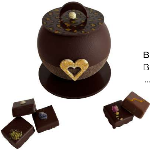
BONBONNIÈRE (MOYEN MODÈLE) Bonbonnière garnie de 18 pièces